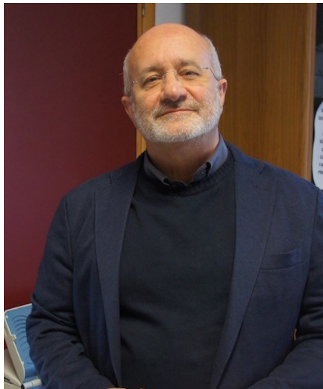
Il Prof. Fabrizio Ammirati ©

Migliorare i percorsi di cura e la gestione clinica delle malattie, soprattutto croniche, con l'applicazione di sistemi di sanità digitale. Questo è possibile oltre che necessario, come ha dimostrato nell'ultimo anno lo stato di emergenza causato dalla pandemia da Covid 19. Alla luce della recente spinta alle innovazioni